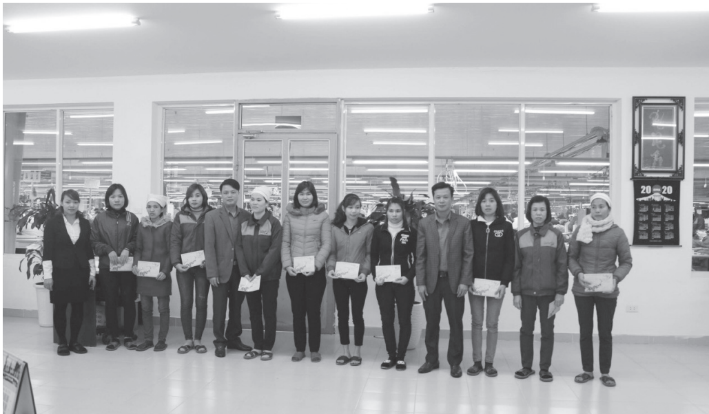
Các đồng chí Thường trực Liên đoàn Lao động huyện thăm và tặng quà cho Người lao động có hoàn cảnh khó khăn

H uyện Sông Lô hiện có 85 CĐCS, trong đó Công đoàn huyện quản lý trực tiếp 79 CĐCS (giảm 02 CĐCS so với cùng kỳ do hợp nhất 04 trường Tiểu học thành 02 trường Tiểu học); quản lý phối hợp 05 CĐCS. Tổng số CNVCLĐ trên địa bàn huyện là 3.175 người, số đoàn viên Công đoàn là 2.717 người. Trong thời gian qua, hoạt động Công đoàn trên địa bàn huyện