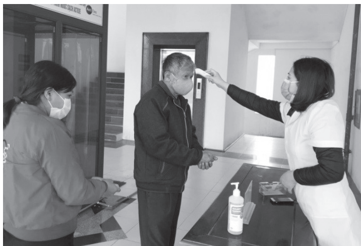
Cán bộ Y tế khử khuẩn và đo thân nhiệt người đến làm việc tại Huyện ủy - HĐND - UBND huyện

Nhằm thực hiện tốt việc cách ly xã hội, các hoạt động vui chơi giải trí, văn hóa, văn nghệ, thể dục thể thao, các phòng khám tư nhân, tuyến xe khách, xe buýt trên địa bàn tạm dừng hoạt động trong khoảng thời gian từ ngày 01/4/2020. Trong thời gian này, đa số người dân trên địa bàn huyện chấp hành quy định hạn chế ra đường. Chỉ ra ngoài trong trường hợp thật sự cần thiết