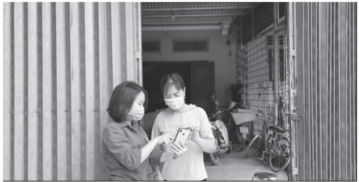
Đoàn Thanh niên xã Nhạo Sơn hướng dẫn người dân khai báo y tế trên ứng dụng NCOVI

Khác với mọi năm, tháng thanh niên năm nay trong thời điểm dịch Covid-19 diễn biến phức tạp, đòi hỏi lực lượng đoàn thanh niên cần có những hoạt động vì cộng đồng. Do đó để hạn chế các hoạt động tập trung đông người, Ban Thường vụ Đoàn Thanh niên xã đã chỉ đạo, triển khai các hoạt động, nhiệm vụ trong tháng thanh niên của tuổi trẻ xã Nhạo Sơn thông qua các ứng dụng công nghệ thông tin; các thông tin, phần việc được giao cụ thể cho các đồng chí ủy viên BCH, Bí thư chi đoàn các thôn dân cư, đặc biệt là các thông tin về tình hình dịch bệnh đang